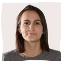
Charlotte ASE 100%